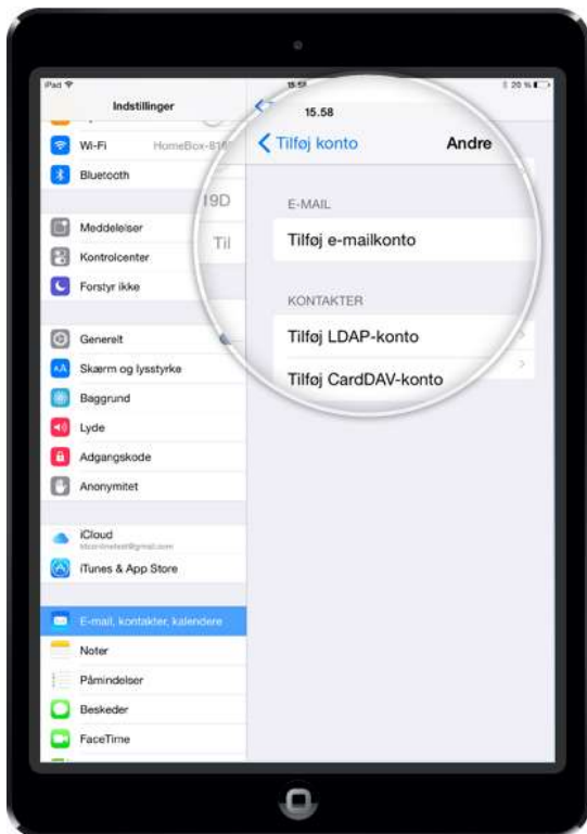
4. Tryk på Tilføj e-mailkonto under E-mail