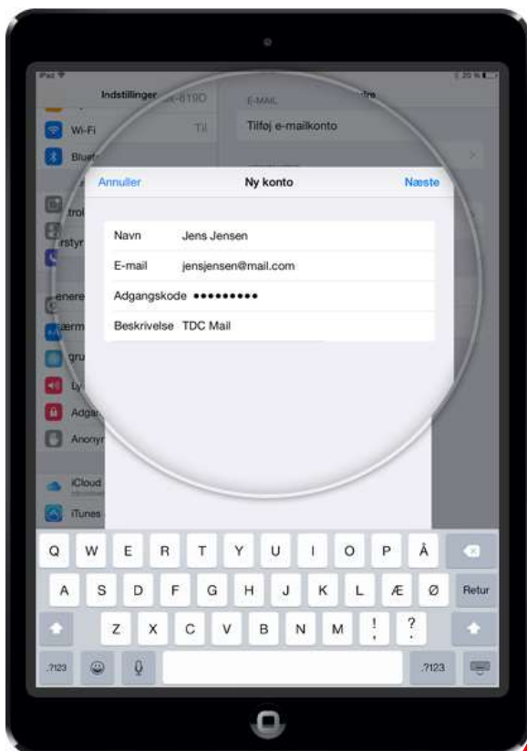
5. I Ny konto skal du gøre følgende:

Navn: Indtast det navn, du ønsker at bruge E-mail: Indtast TDC e-mail-adresse Adgangskode: Indtast TDC Mail adgangskode Beskrivelse: Indtast TDC Mail Tryk på Næste